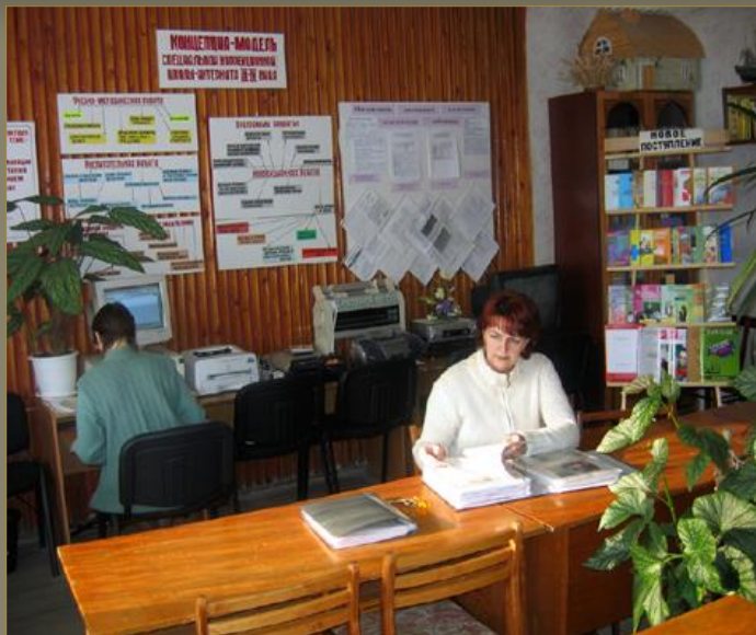
< Методический кабинет